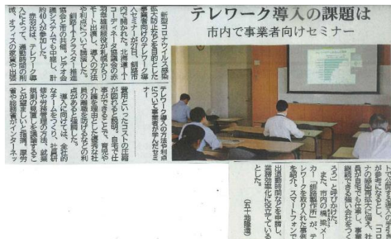
【2020年8月28日北海道新聞掲載】