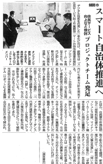
【2021年3月9日釧路新聞掲載】

デジタル技術を活用した住民サービス向上や業務効率化に向け、釧路市が発足したプロジェクトチームに中島会長がメンバーとして出席した。