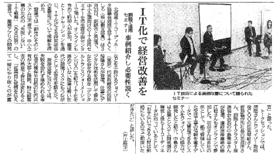
【2021年4月3日釧路新聞掲載】